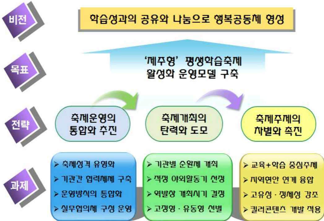
[ 그림 Ⅲ-1 ] 제주지역 평생학습축제의 활성화 추진체계